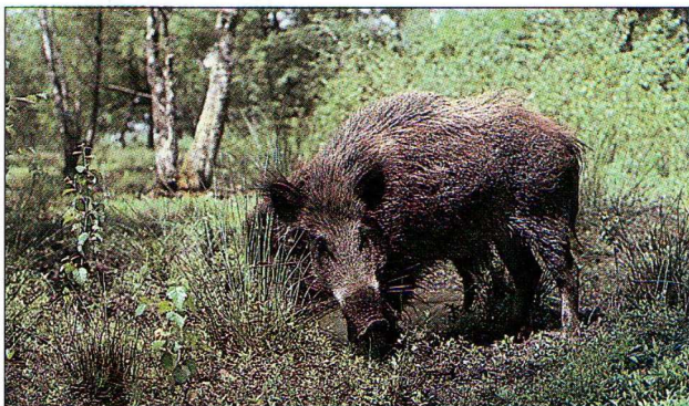
Recherche de nourriture