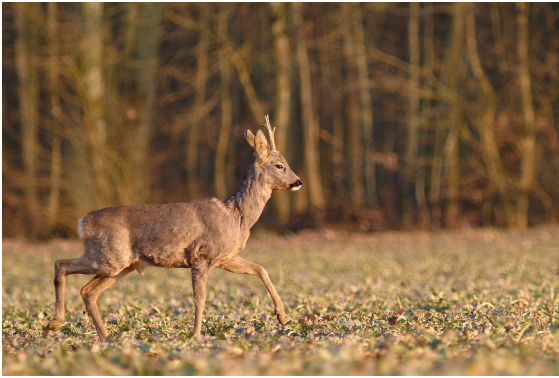
Un jeune brocard

Située sur le flanc ouest de la colline cette source ne tarit pas en été et sert de réserve d'eau pour les animaux de la forêt, les chevreuils et les sangliers entre autres.