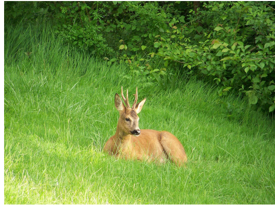
Reste de serviette autour du cou.

Le chevreuil est un petit animal agile et très rapide, à la robe brunâtre et à la face un peu grise qui vit environ une dizaine d'années à l'état sauvage. Le chevreuil est dit anoure , c'est-à-dire sans queue . La tache claire et érectile qui orne le fessier est dite miroir . En hiver, certains chevreuils ont la base du cou ornée d'une ou deux taches claires dite serviette .