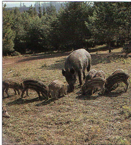
Laie avec ses marcassins

De 6 mois à 1 an, leur pelage devient roussâtre et ils s'appellent bêtes rousses. Ils deviennent ensuite bêtes noires ou bêtes de compagnie jusqu'à 2 ans, puis ragots, tiers-ans (de 3 à 4 ans), quartaniers (de 4 à 5 ans), puis de vieux sangliers et enfin solitaires.