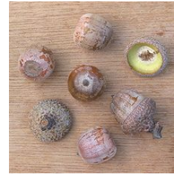
Chêne rouge d'Amérique

Les jeunes plants ont été mis en place en 2013. Cette parcelle avait été plantée en épicéas en 1964 mais avait subi les affres de la tempête Klaus. La partie basse a été plantée en chêne sessile et la partie haute en chêne rouge d'Amérique . La colonisation de fougères et de châtaigniers a rendu les premières années de culture difficiles. La protection collective faite de grillage permet d'éloigner les chevreuils friands de ces jeunes pousses.