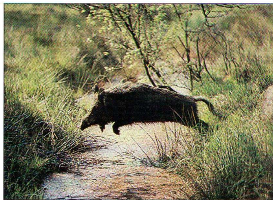
En pleine course

Des battues de destruction sont fréquemment effectuées lorsque les dégâts des sangliers dans les cultures riveraines des forêts sont trop importants.